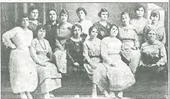
Членки на първото българско женско дружество в САЩ "България в Америка", лялото на 1917 г.

Из том I на "История на българската емиграция в Северна Америка. Поглед отвътре"